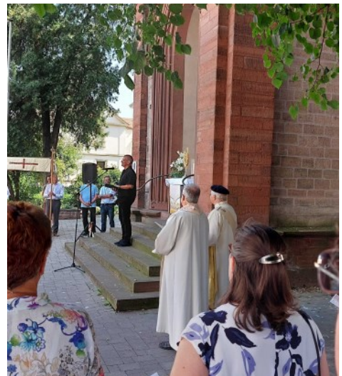
Erste Station vor der Evang. Kirche