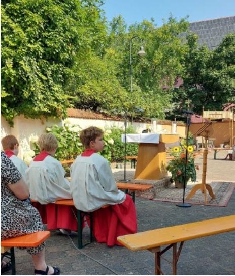
Gottesdienst unter freiem Himmel