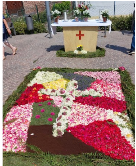
Fleißige Hände haben am frühen Morgen den Blumenteppich gelegt