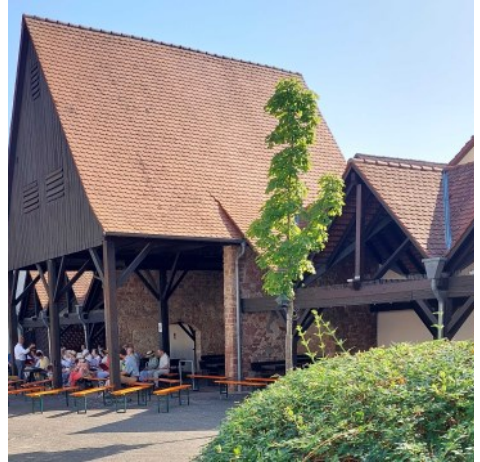
Der Kirchenchor probt in der Heddesheimer Scheunengalerie