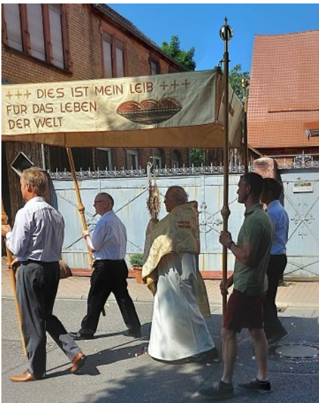
Unterwegs zur zweiten Station