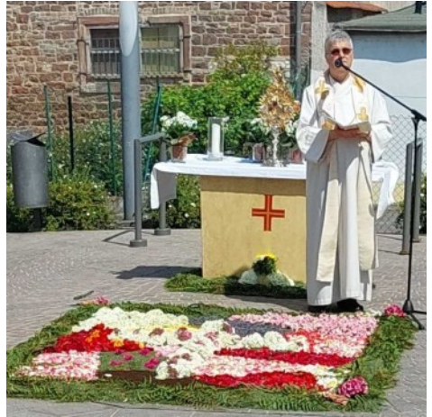
Station mit Blumenteppich auf dem Dorfplatz